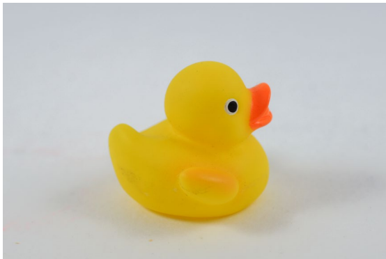
Modelle wie diese Gummiente können aufgrund zu weniger Merkmale schwierig zu scannen sein.

In diesen Fällen kommt natürlich auch Sprühkreide zum Einsatz, jedoch nicht um das komplette Objekt zu mattieren, sondern erst einmal nur, um das Objekt mit Tausenden von kleinen kontrastreichen Punkten zu besprenkeln. Die so entstandenen Punkte werden von der Software dann als Merkmal erkannt. In den meisten Fällen wird der gewünschte Effekt somit schon erreicht und man erhält gute 3D-Scan-Ergebnisse.