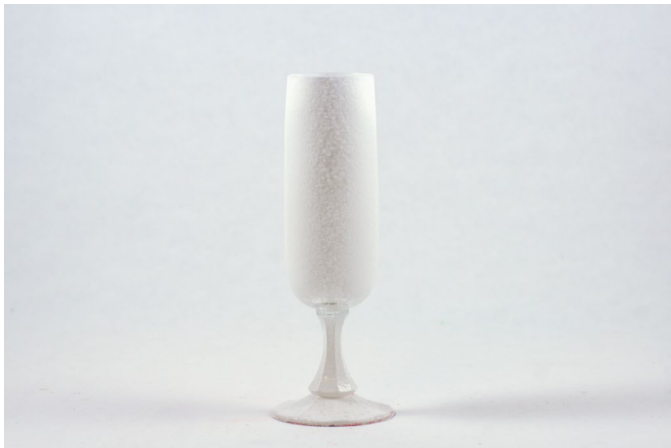
Glas mit weißer Sprühkreide mattiert, mit Laserscanner scanbar