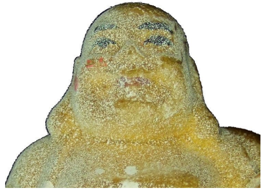
Fotografie mit Kreuzpolfilter

Die Ausrichtung der beiden Filter können Sie vorab durch ein einfaches Experiment testen. Legen Sie beide Filter übereinander auf ein weißes Blatt Papier. Rotieren Sie nun einen der beiden Filter, können Sie ganz deutlich den Polfilter-Effekt erkennen.