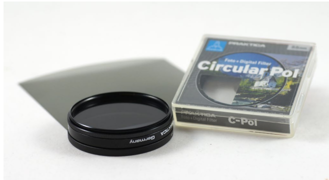
Polfilter für digitale Spiegelreflexkamera und Polfilterfolie

Polarisationsfilter oder kurz »Polfilter« sind in der Fotografie ein bewährtes Werkzeug, um unter anderem Spiegelungen auf Wasser, Glas oder Metalloberflächen zu unterdrücken.