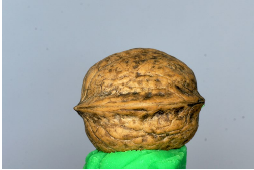
Walnuss in horizontaler Position mit Knete am Drehteller fixiert