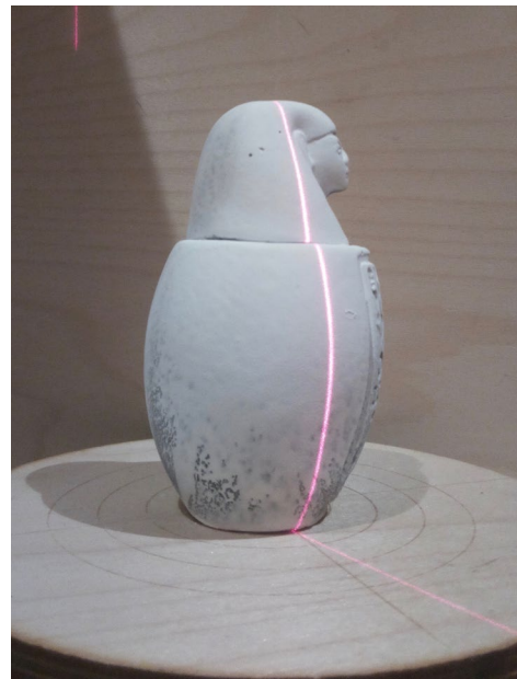
Gleiches Objekt mit Kreidebehandlung, der ist Laser durchgängig gut erkennbar.