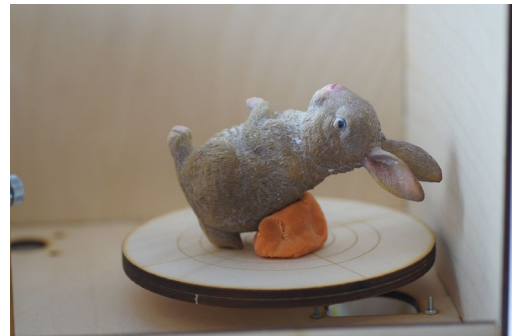
Objekt in zweiter Scan-Position für einen weiteren Scan-Durchgang mit Knete in seitlicher Lage fixiert