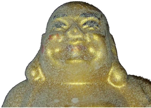
Fotografie ohne Polfilter