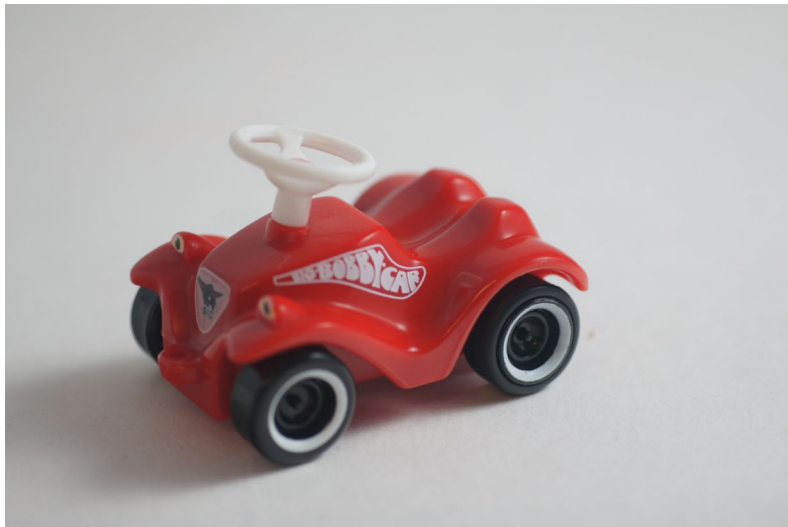
Fotografie mit Polfilter

Ein automatischer Prozess zum Erstellen der Bilder, wie in Kapitel 3.2 ab Seite 61 beschrieben, führt bei einmaliger Einstellung des Polfilters nicht unbedingt zum bestmöglichen Ergebnis. Der Filter muss je nach Beschaffenheit der Objektoberfläche bei jeder Aufnahme neu eingestellt werden, was recht mühsam und aufwendig sein kann. Gerade beim 3D-Scannen, wo die Textur des Objekts gelingen soll, wird man anschließend jedoch mit einem guten Ergebnis belohnt.