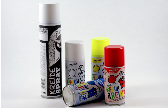
Sprühkreide als günstige Alternative zu 3D-Scan-Spray

werden. Sprühkreide findet man für kleines Geld in allen möglichen Farben im Spielwarenhandel oder in diversen Online-Shops.