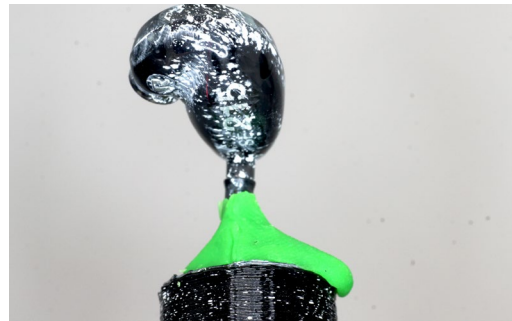
Ohrmuschel-Scan aus einer anderen Position

Abhilfe schafft hier der Einsatz von handelsüblicher Spielknete. Diese lässt sich sehr gut modellieren und haftet gut an den meisten Oberflächen. Spielknete finden Sie in Online-Shops, Spielwarenläden oder in 1-Euro-Läden. Weil die Knete mitgescannt wird, muss sie – wie in Abschnitt 5.2.3 ab Seite 169 gezeigt – im Scan-Ergebnis entfernt werden.