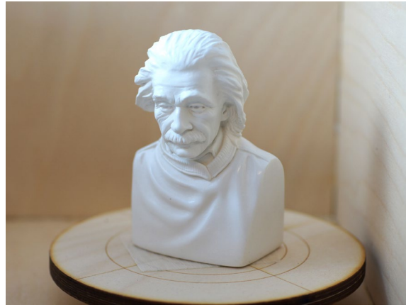
Objekt mit Klebeband fixieren

Um das zu vermeiden, gibt es verschiedene Optionen. Die naheliegendste und einfachste Option besteht darin, das Objekt mittels doppelseitigem Klebeband gegen Verrutschen zu sichern. Hierbei genügt es meist, ein kleines Stück doppelseitiges Klebeband an einer glatten Fläche des zu scannenden Objekts anzubringen. Alternativ könnten Sie die gesamte Oberfläche des Drehtellers mit doppelseitigem Klebeband versehen. Allerdings hält das Klebeband nicht ewig. Durch Verschmutzung und Staub auf dem Klebeband lässt die Klebewirkung irgendwann nach. Es kann dann sehr mühsam sein, das Klebeband wieder rückstandslos vom gesamten Teller zu entfernen. Aus diesem Grund empfiehlt sich der Einsatz von doppelseitigem Klebeband vorzugsweise direkt am Objekt.