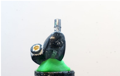
Ohrmuschel-Scan bei der Fotogrammetrie – erste Position

Im Fall des in Kapitel 3.2 ab Seite 61 vorgestellten Fotogrammetrie-Scanners wird der Drehteller an einem rotierendem Arm befestigt. In diesem Fall reicht keine Gummimatte und im schlechtesten Fall auch kein Klebeband, um das Objekt gegen Herunterfallen vom Drehteller zu sichern. Der Drehteller wird oft bis 90° geneigt, dann auch noch in Rotation versetzt – das ist es kein Wunder, wenn das Klebeband den Dienst quittiert.