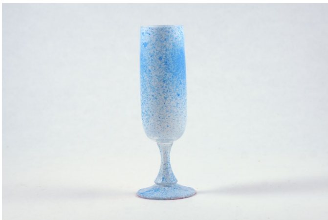
Glas mit weißer Sprühkreide mattiert und anschließend mit blauer Sprühkreide besprenkelt, geeignet für Fotogrammetrie