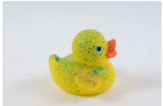
Nach dem Auftragen von Sprühkreide entstehen Merkmale, die von der Software gefunden werden.