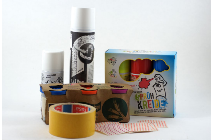
Materialien und Hilfsmittel für das 3D-Scannen

Die größten Probleme stellen dabei transparente, reflektierende oder gar verspiegelte Objektoberflächen dar. Aber auch zu dunkle Objekte bringen das ein oder andere Problem mit sich. So wird bei vielen nichtkontaktbasierten aktiven Verfahren das Lichtmuster von schwarzen Untergründen derart absorbiert, dass die Bildberechnungsalgorithmen schwer zu kämpfen haben.