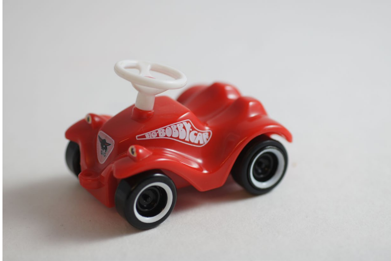
Fotografie ohne Polfilter