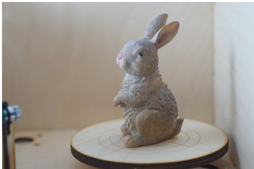
Objekt stehend für einen ersten Scan-Durchgang

Die Knetmasse sollte nach Verwendung zur Aufbewahrung immer zurück in ihre Dose getan werden, da sie dazu neigt, an der Luft hart und porös zu werden. Dann ist sie nicht mehr haftfähig und zumindest zum Befestigen von Objekten am Drehteller nicht mehr geeignet.