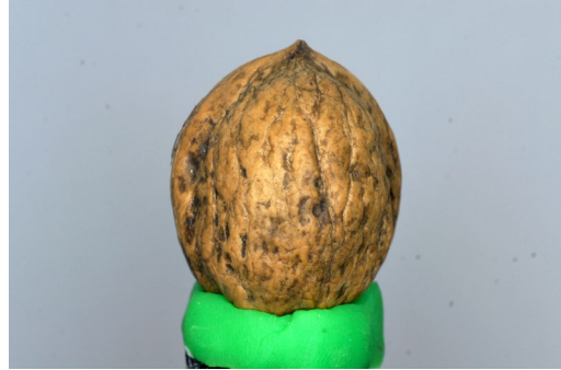
Walnuss in vertikaler Position mit Knete am Drehteller fixiert

Wenn die Knete die gleiche Farbe wie das Objekt aufweist und Sie exakt arbeiten möchten, kann die Unterscheidung zwischen Objekt und Knete schwierig werden. Aus diesem Grund sollten Sie immer Knete in unterschiedlichen Farben zur Hand haben.