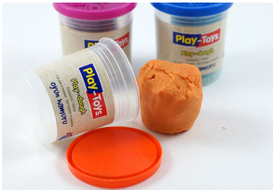
Handelsübliche Spielknete zum Fixieren von Objekten auf dem Drehteller

Oft gelingen 3D-Scans nicht, weil das Objekt während des 3D-Scans auf dem Teller verrutscht oder umfällt. Oder ein Objekt muss in verschiedenen Positionen gescannt werden, um es komplett erfassen zu können. In all diesen Fällen stehen Sie dann vor dem Problem, das zu scannende Objekt sicher und stabil auf dem Drehteller zu fixieren. In diesem Kapitel zeige ich Ihnen einige Möglichkeiten, wie Sie Objekte mit einfachen Mitteln fixieren und somit gegen Umfallen oder Verrutschen sichern können.