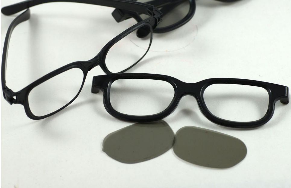
3D-Brille aus dem Kino, aufgetrennt, um die Polfilter Folie zu entnehmen.

Für erste einfache Experimente können Sie natürlich auch diese Filter verwenden. Allerdings müssen Sie bedenken, dass die in den Brillen verbauten Filter verhältnismäßig klein sind und sich so für den Einsatz mit Spiegelreflexkameras und größeren Objektiven weniger gut eignen. Bei den meisten Kompaktkameras, Smartphones oder bei der Raspberry-Pi-Kamera können diese Brillen dennoch hilfreich sein.