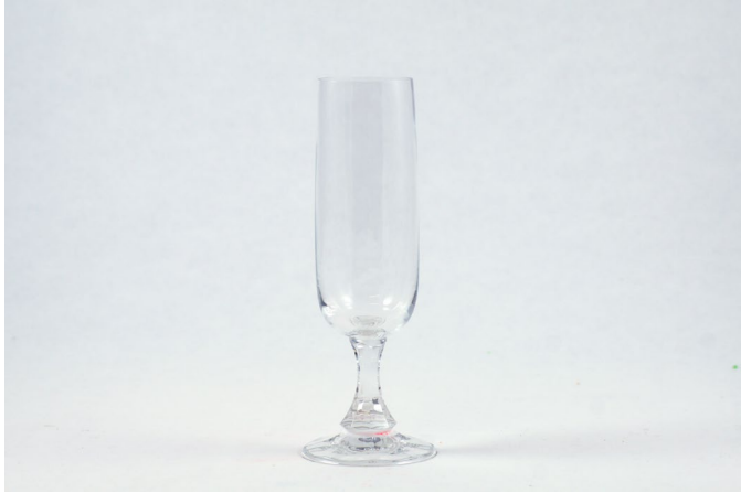
Glas unbehandelt, schwer bis nicht 3D-scanbar