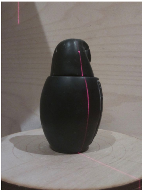
Dunkles leicht glänzendes Objekt ohne Kreidebehandlung, im oberen und unteren Bereich ist der Laser schlecht erkennbar.

Beim 3D-Laserscannen können Sie die Sprühkreide vor allem dazu nutzen, transparente, reflexive, aber auch sehr dunkle Objekte zu mattieren. Trifft der Laserstrahl auf ein transparentes Objekt, so scheint er hindurch und das in Kapitel 3.1 ab Seite 30 beschriebene Laserscan-Verfahren funktioniert nicht mehr. Mit Sprühkreide mattiert, wird das Objekt für das Laserlicht »undurchdringbar«, es ist wieder eine klare Laser-Linie auf der Oberfläche des Objekts sichtbar. Ist das Objekt stark reflektierend wie beispielsweise Objekte aus Metall, so bricht der Laserstrahl facettenartig auf. Eine klare Linie ist dann für die Software nicht mehr zu erkennen. Wird das so reflektierende Objekt jedoch ebenfalls mit Sprühkreide mattiert, entsteht eine matte Oberfläche und es ist wieder eine klare und scharfe Laser-Linie erkennbar. Dunkle Objekte können je nach Stärke des Lasers das Licht so stark absorbieren, dass auch hier keine klare Erkennung der Laser-Linie durch die Software mehr möglich ist. Auch in diesem Fall hilft das Einsprühen des Objekts mit weißer Sprühkreide. Für das Scannen mit dem Laserscanner reicht in der Regel eine Farbe aus. Am besten eignet sich für die genannten Fälle weiße Sprühkreide.