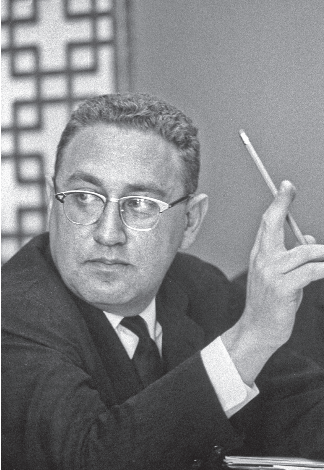
Bei einer von der Zeitschrift «Life» veranstalteten Diskussion, Mai 1963.