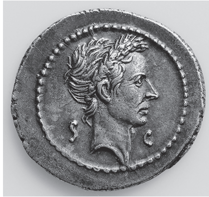
Abb. 1 C. I. Caesar (100–44 v. Chr.), Portrait auf einem Denar, geprägt (40 v. Chr.?) nach seinem Tod.

Als Erstes wurden die Helvetier 59 v. Chr. in der Schlacht bei Bibracte besiegt und die Überlebenden zur Rückkehr in ihre alte Heimat gezwungen. 58 v. Chr. folgte dann im Elsass der Sieg über die Sueben. Konflikte mit den nordgallischen Belgiern, darunter den Eburonen, und langwierige Kämpfe mit anderen Stämmen blieben nicht aus, ebenso immer wieder Rückschläge durch Aufstände bereits unterworfenen gallischer Stämme. Höhepunkt der Entwicklung war im Jahr 52 v. Chr. ein gesamtgallischer Aufstand mit der Belagerung von Alesia und der Kapitulation des gallischen Anführers Vercingetorix. Damit war dann schließlich ab 51 v. Chr. ganz Gallien bis zum Rhein der römischen Herrschaft unterstellt. Nun setzte der Prozess der römischen Erschließung und Umgestaltung Galliens als römisches Provinzgebiet ein, der zwar vorerst mit der Ermordung Caesars 44 v. Chr. vorübergehend stagnierte, aber nie gänzlich in Frage gestellt war.