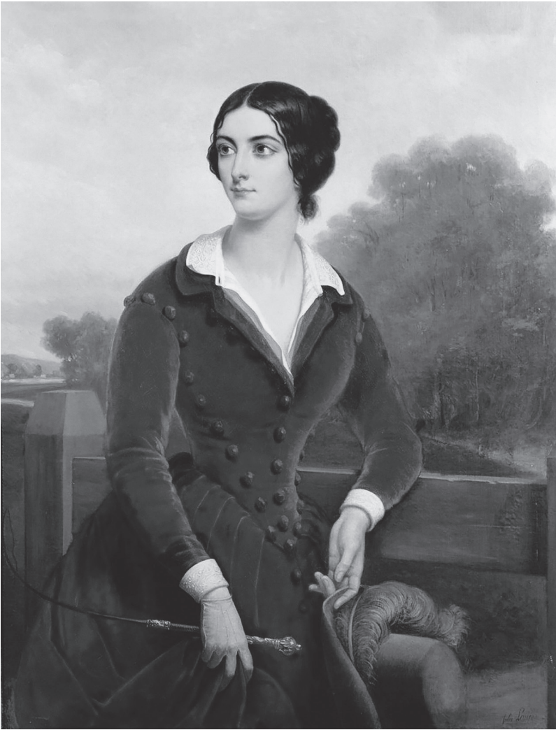
Lola Montez im samtroten Reitkostüm mit Reitgerte und Federhut. Gemälde von Jules Laure, Paris 1844, Vorlage für eine weitverbreitete Lithografie von 1846