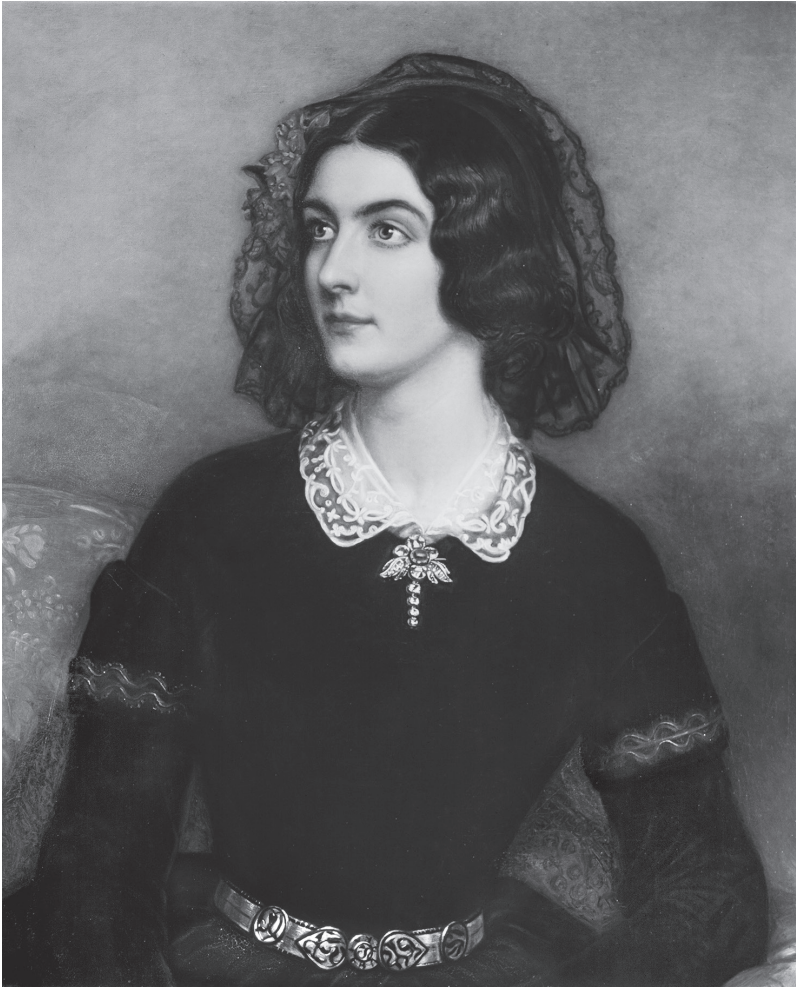
Die Bildikone. Porträt der Lola Montez von Joseph Karl Stieler, 1847

fügten weltweit hunderte Journalisten, Romanciers, Filmemacher und Historiker neue Details und Facetten zur Lebensgeschichte dieser Frau hinzu, übernahmen alte Berichte und schmückten sie aus, versuchten die «Wahrheit» herauszufinden und empörten sich über die fast undurchdringlichen Gespinste aus Erfindungen und Halbwahrheiten, die sie nicht zuletzt in Lola Montez' autobiografischen Texten wie ihren Memoiren von 1851 und auch noch in der «Autobiography» von 1858