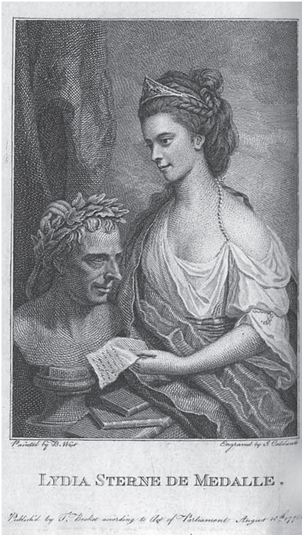
Abb. 1 James Caldwell nach Benjamin West, Lydia Sterne bekrönt die Büste ihres Vaters, Titelblatt zu Lydia Sternes Ausgabe der Briefe Laurence Sternes, 1775, Kupferstich und Radierung, 14,5 × 9 cm