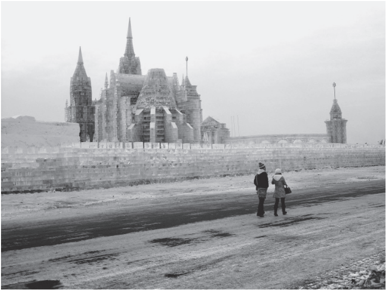
Eis- und Schneefest im chinesischen Harbin

preis ausgezeichnet. Die Urkunde für ein Semesterstipendium löste ich ein Jahr später in Kasan ein, wo ich nach der Lebenswelt alter Moskowiter nun die raue Wirklichkeit der russischen Provinzjugend kennenlernen sollte. Zu jener Zeit begann ich wieder mit dem journalistischen Schreiben.