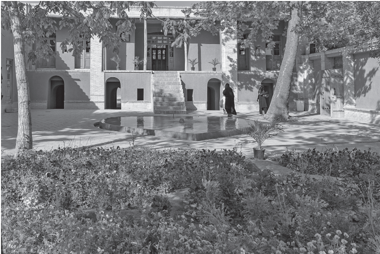
Das Geburtshaus des späteren Revolutionsführers in Khomein im Jahre 2011. Heute ist es ein Museum.

nach Indien, wo sie sich in einer kleinen Stadt namens Kintur nahe Lucknow niederließ. Das dortige Königreich von Oudh wurde von Zwölferschiiten beherrscht. Khomeinis Großvater, Seyyed Ahmad Musavi Hindi, wurde noch in Kintur geboren. Er verließ Indien im Jahr 1830, um die Pilgerfahrt nach Nadschaf im heutigen Irak anzutreten. Vermutlich wollte er auch dort studieren. Er sollte nie wieder nach Indien zurückkehren, denn in Nadschaf freundete er sich mit einem Landbesitzer aus dem Dorf Farahan unweit von Khomein an, der ihn überzeugte, mit ihm nach Iran zu kommen. 1834 übersiedelten die beiden, und ungefähr fünf Jahre später erwarb Seyyed Ahmad ein großes Haus mit üppigem Garten in Khomein, das mehr als anderthalb Jahrhunderte lang im Familienbesitz bleiben sollte. Ob er Geld aus Indien mitgebracht hatte oder erst in Iran zu Wohlstand gelangt war, ist unklar, jedenfalls war er für damalige Verhältnisse ein reicher Mann. Der 4000 Quadratmeter große Besitz hatte Seyyed Ahmad die damals durchaus hohe Summe von 100 Toman gekostet.