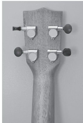
Abbildung 1.2: Direkte Mechanik

Falls Ihre unübersetzte Mechanik also nicht von höchster Qualität ist, raten wir Ihnen unbedingt zum Kauf eines Instruments mit dieser Art von Wirbeln.