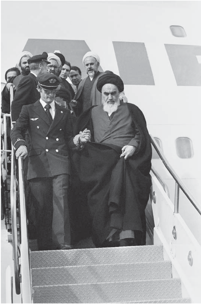
Ayatollah Ruhollah Khomeini bei seiner Rückkehr in den Iran am 1. Februar 1979. Kurz zuvor hatte der letzte Schah das Land verlassen. Khomeinis Fundamentalisten gewannen rasch die Oberhand in der Revolution, und am 1. April wurde die Islamische Republik Iran ausgerufen.

Revolutionsbewegung zunächst eine breite Basis hatte und auch Kommunisten und Demokraten eine wichtige Rolle spielten, gewannen die islamischen Fundamentalisten um Khomeini bald die Oberhand. Am 11. Februar wurde die noch vom Schah gebildete Übergangsregierung gestürzt, 9 und am 30. und 31. März stimmten nach offiziellen Angaben 99,3 Prozent der Wähler für die Ausrufung der Islamischen Republik Iran und eine neue theokratische Verfassung, die am nächsten Tag in Kraft trat. In der Zwischenzeit wurde der Schah wie eine heiße Kartoffel von einem Land ins nächste weitergereicht. Die Flamme breitete sich aus, als er nach Aufhalten in Ägypten, Marokko, auf den Bahamas und in Mexiko Ende Oktober 1979 zur medizinischen Behandlung in die Vereinigten Staaten einreisen durfte. Zwei Wochen später stürmten radikale Aktivisten die ame-