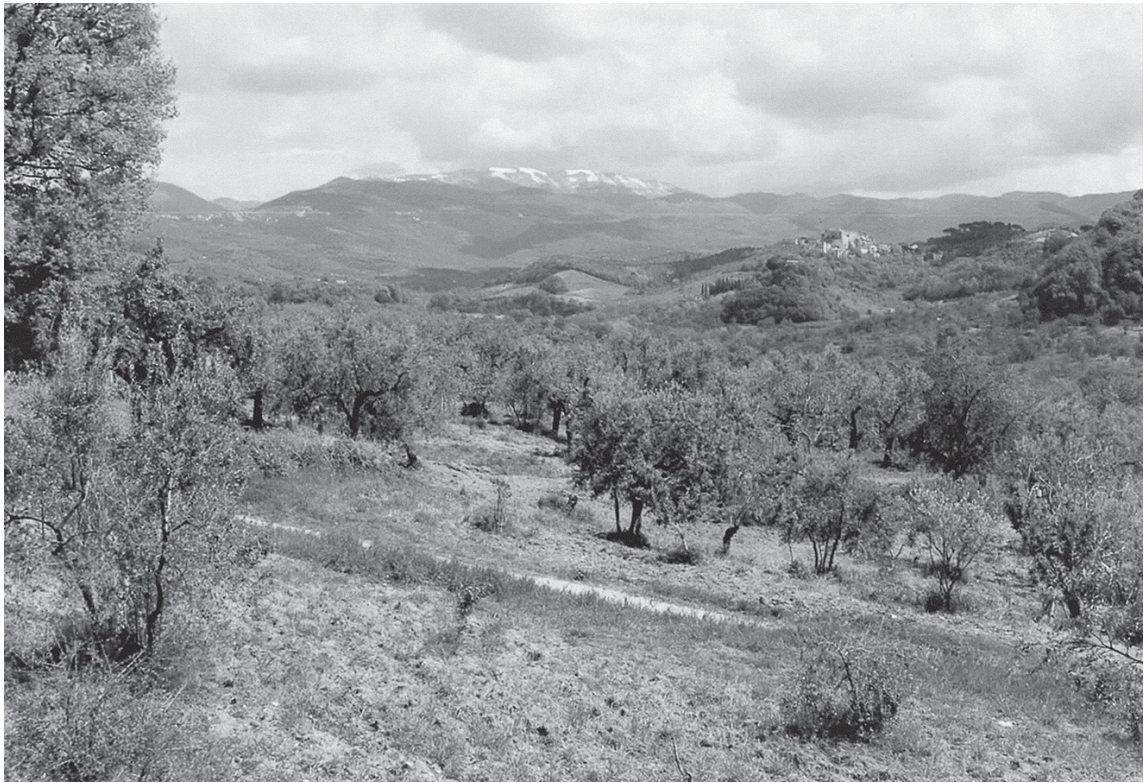
Abb. 1. Die Via Salaria beim Eintreten ins Bergland der Sabina. Vorn querend die alte Trasse, gegen Monti Lucretili und Montelibretti, im Aufstieg durch die Contrada Sterparelle. Irgendwo hier stand der 24. Meilenstein, bei dem Varro das Gut seiner Tante lokalisiert, seine regelmäßige Reisestation auf der Salaria.