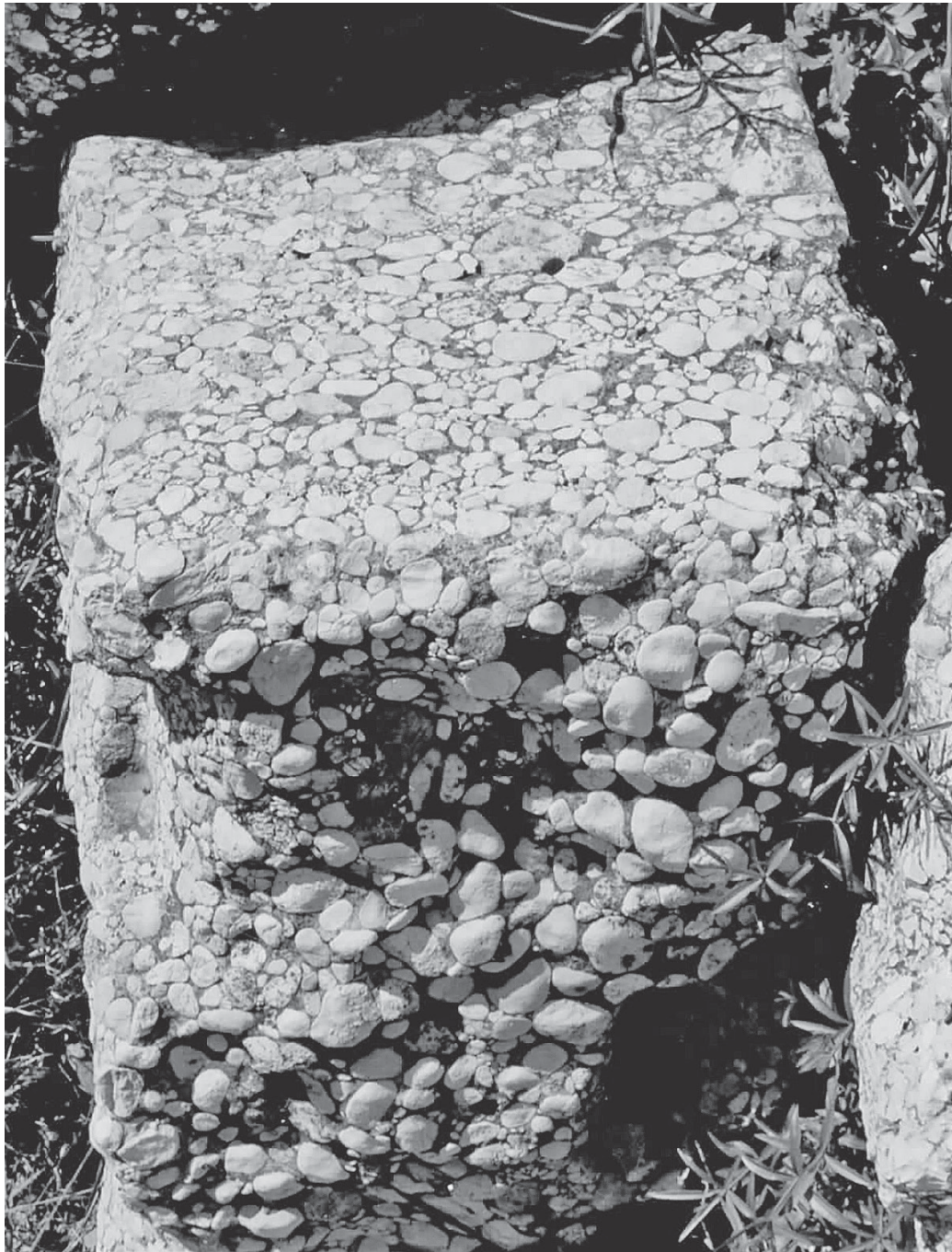
Abb. 2. Bei dem hier anstehenden, zum Straßenbau verwendeten Konglomeratgestein ist Bearbeitung (hier die obere Fläche) schwerer zu erkennen als beim charakteristischen Basaltpflaster der anderen römischen Konsularstraßen.