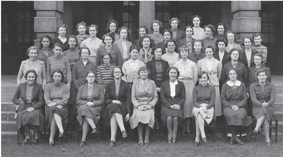
Iris Murdoch (zweite Reihe, Vierte von rechts) und Mary Scrutton (erste Reihe, Vierte von links) auf dem Immatrikulationsfoto, Somerville 1938

waren, Honour Moderations und Literae Humaniores zu studieren. 39 Dieser auf vier Jahre angelegte Studiengang, der besser unter der Bezeichnung Mods and Greats bekannt ist, bestand aus zwei Teilen. Mods umfasste fünf Trimester und schloss mit zwölf jeweils dreistündigen Prüfungen an sieben aufeinanderfolgenden Tagen ab. Die Prüflinge mussten ihnen unbekannte Auszüge aus der griechischen und lateinischen Dichtung und Prosa mühelos übersetzen können. Hatten sie bestanden, dann schloss sich daran ein Studium der Greats über sieben Trimester hinweg an, in dem es um griechische und römische Geschichte, Archäologie, Kunst und Philosophie ging. 40 Außerdem wurde darin auch ein wenig moderne Philosophie bis zu Kant und darüber hinaus (einschließlich Hegel und Marx) gelehrt, zudem etwas Logik, Ethik und politische Philosophie. Den größten Teil des Lehrplans nahm jedoch die antike Philosophie ein, neben ihrer Rezeption im christlichen Denken des Mittelalters. Platons Politeia und Aristoteles' Nikomachische Ethik , die sie auf Griechisch lasen, waren dabei ihre Hauptlektüre. In ihrem ersten Jahr der Greats konnten Iris und Mary unter vierzehn Lektürekursen wählen, die Werken gewidmet waren, welche älter als zweitausend Jahre waren.