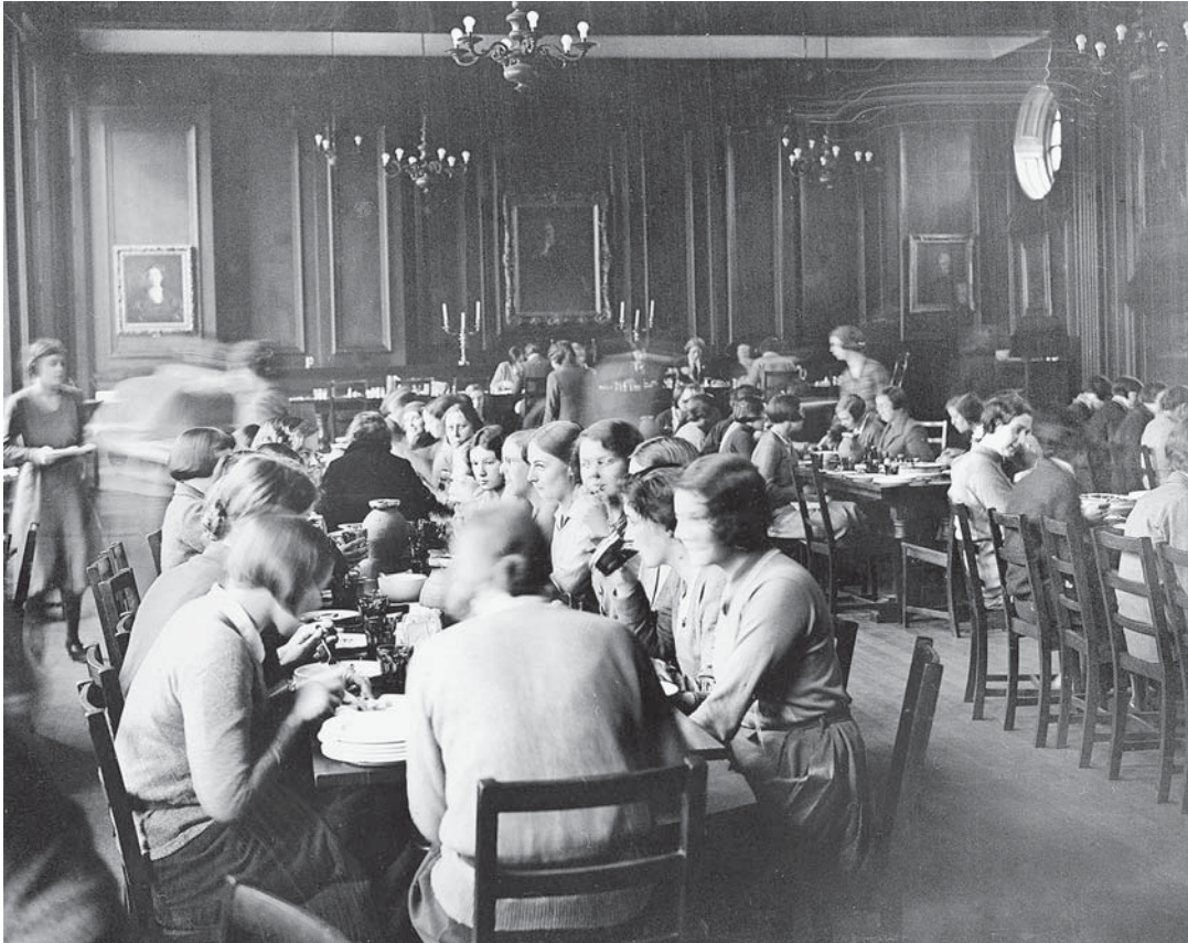
Speisesaal des Somerville College in den 1930er Jahren