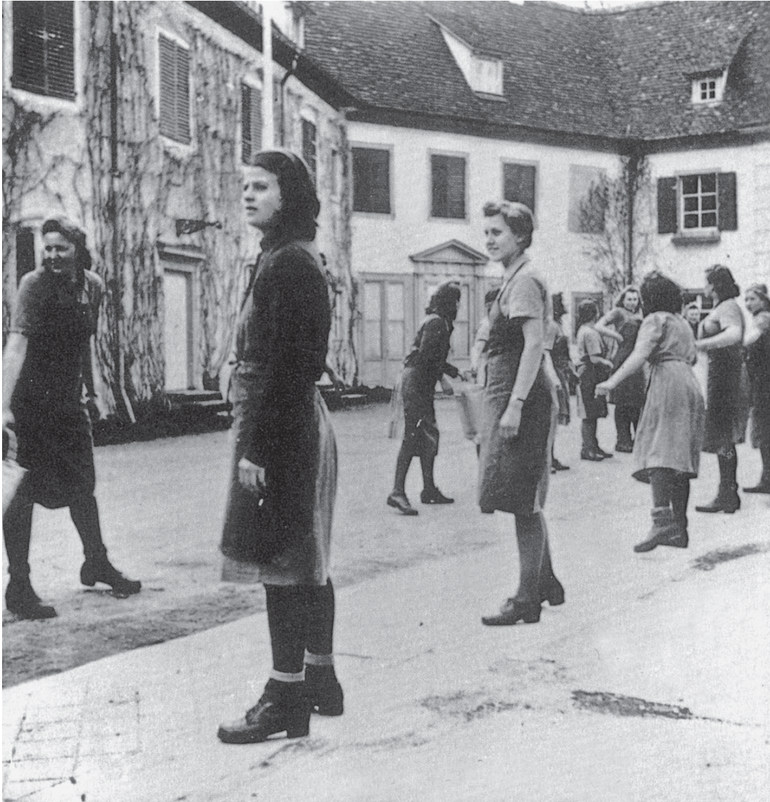
Sophie Scholl (2. v. li.) im Reichsarbeitsdienst, Krauchenwies, Frühjahr 1941