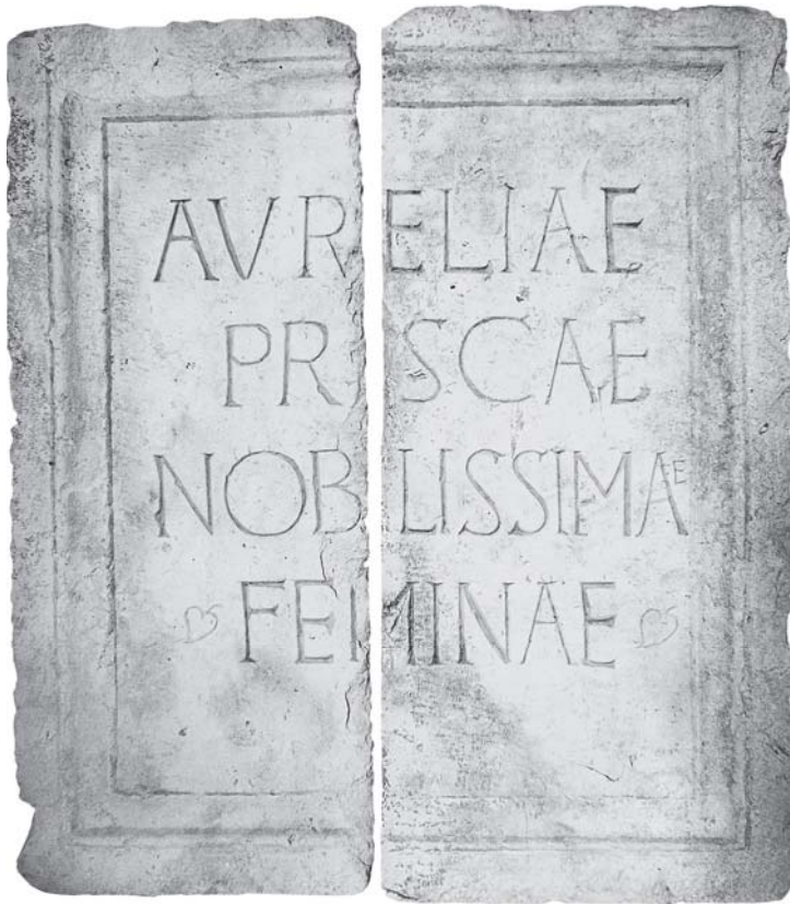
Abb. 1: Die einzige Inschrift der Kaiserin Prisca, Museum Salona. Auf dem Foto kaum zu sehen ist das hochgestellte Dativ-E, NOBILISSIMAE.