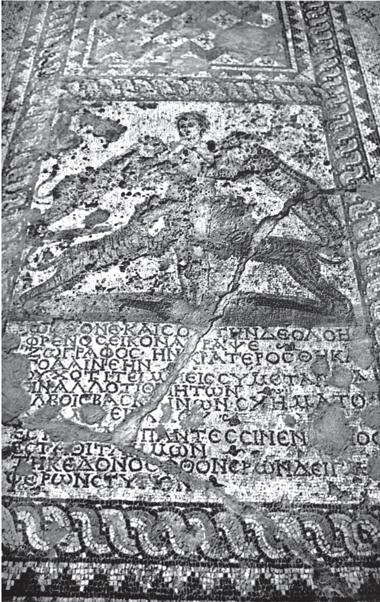
Grün vor Neid: Der Gott Phthonos ist der Sohn von Dionysos und der Nachtgöttin Nyx. Er verkörpert die Missgunst. Das Mosaik von der Insel Kefalonia stellt ihn dar, wie er von wilden Tieren zerrissen wird.

weggetragen oder Sklaven entlaufen konnten. Schlafzimmertüren in Pompeji und Herculaneum wurden mit einfachen Riegeln verschlossen. Selbst in Militärlagern traute man einander offenbar so wenig über den Weg, dass man alles, was nicht niet- und nagelfest war, gut verschlossen aufbewahrte – darunter vermutlich auch geheime Dokumente, die neugierigen Blicken und dem Zugriff Unbefugter entzogen sein sollten. Das Militär besaß sogar eigene Werkstätten für die Produktion von Schlössern und Schlüsseln.