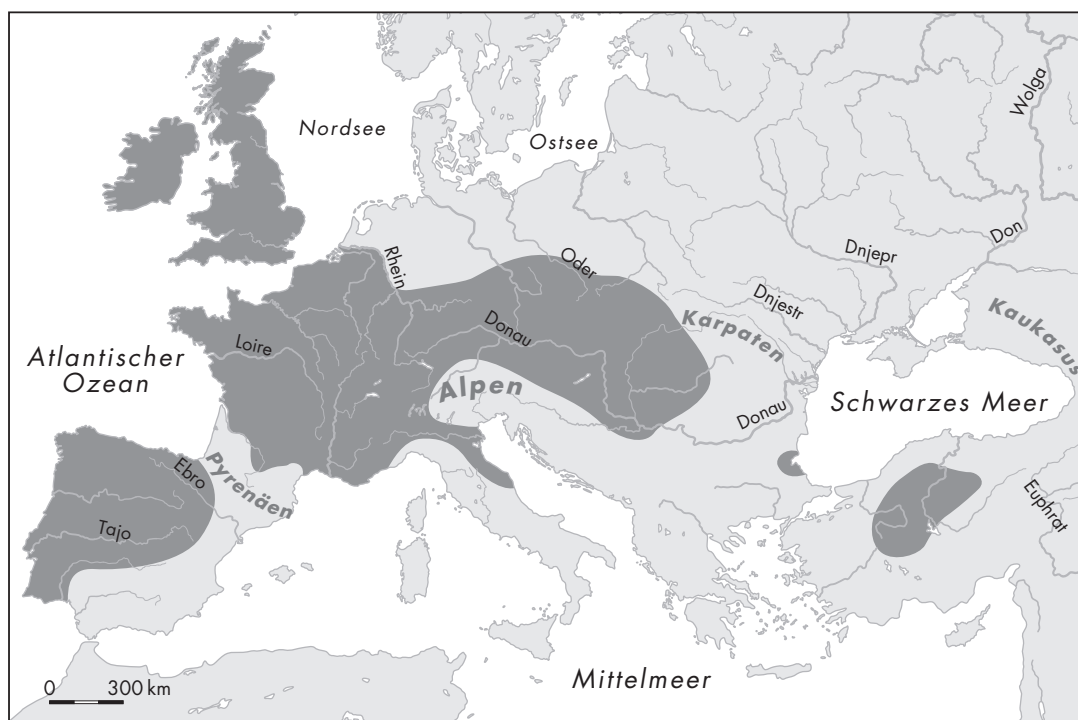
Mutmaßliches Verbreitungsgebiet der keltischen Sprachen zur Zeit ihrer größten Ausdehnung im 2./1. Jahrhundert v. Chr.

Im Unterschied zum diffusen Keltenbegriff der Antike bezieht sich «Keltisch» in der zu Beginn des 19. Jahrhunderts entstandenen Vergleichenden Sprachwissenschaft ausschließlich auf sprachliche Gegebenheiten. 7 Dazu muss man allerdings wissen, dass die Kelten des europäischen Festlands und Kleinasiens ihre Sprache bis zum Ausgang der Antike gegen das Lateinische bzw. Griechische eingetauscht hatten und mit dem Übergang zum Mittelalter auch die Kenntnis des historischen Zusammenhangs zwischen den Idiomen der antiken Kelten und den Sprachen der Iren, Hochlandschotten, Waliser und Bretonen verloren gegangen war. Erst der schottische Humanist George Buchanan (1506–1582) entdeckte diesen Zusammenhang wieder von Neuem, und erst seit dem 18. Jahrhundert setzte sich dann der Name «Keltisch» als Oberbegriff zur Bezeichnung sowohl der Sprache der antiken Kelten als auch der alteingesessenen Sprachen von Irland, Schottland, Wales und der Bretagne allgemein durch. Starken Auftrieb erfuhr die Beschäftigung mit den nunmehr sogenannten keltischen Sprachen seit der Mitte des 19. Jahrhunderts nach der Entdeckung der indogermanischen Spracheinheit durch Sir William Jones (1746–1794), besonders nachdem man in den 1830er Jahren die Zugehörigkeit der in mancher Hinsicht eigentüm-