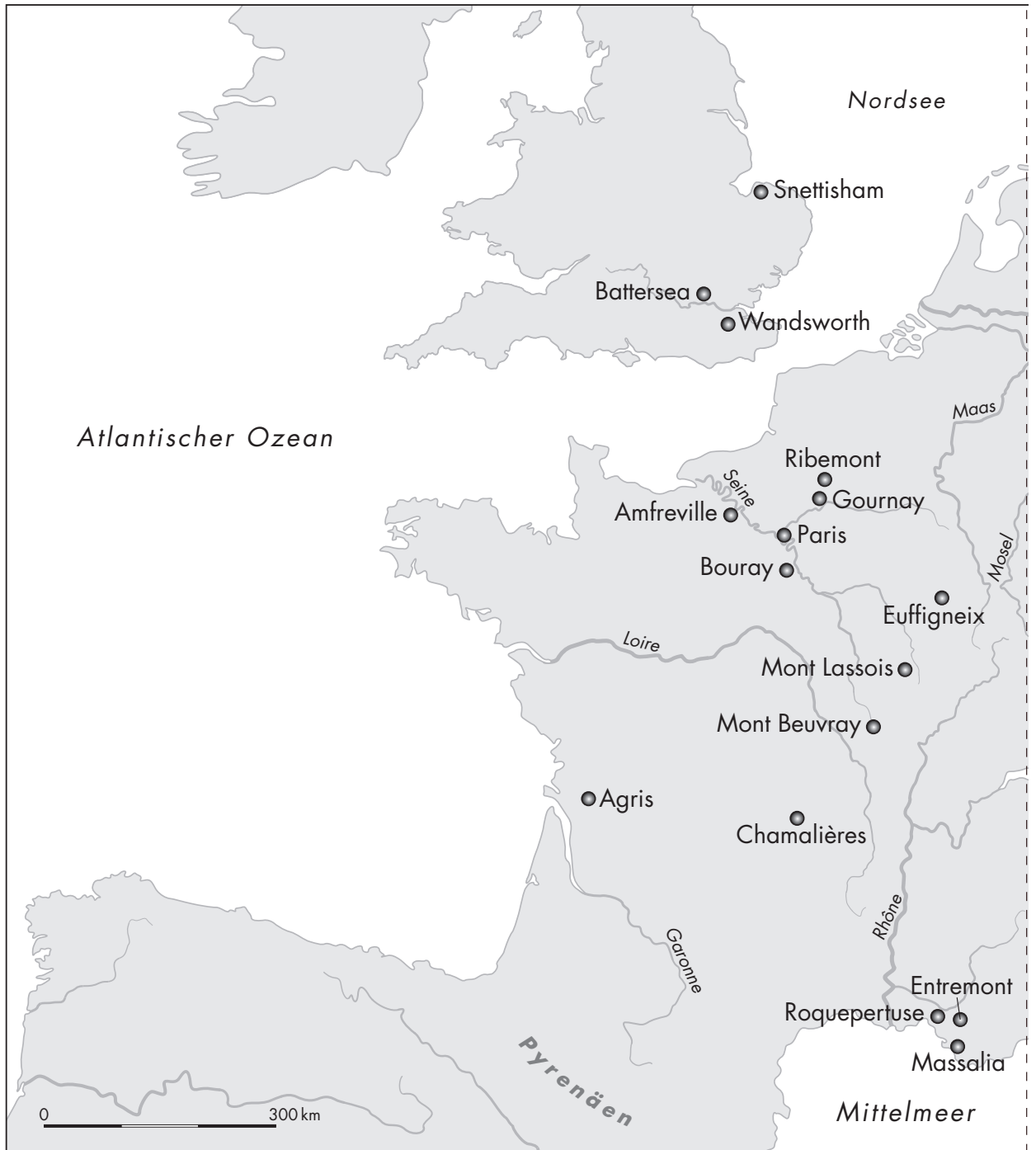
Keltische Fundstätten in Mitteleuropa

halb größerer Siedlungen noch weitgehend unberührt. Ein ausgebautes Straßen- und Wegenetz fehlte, zumal man sich für den Transport von Handelsgütern überwiegend der natürlichen Wasserstraßen bediente. Bäche und Flüsse waren nirgendwo reguliert, und ausgedehnte Wälder beherbergten eine Vielfalt von Tierarten. Die Mobilität des Großteils der Bevölkerung war zweifellos gering, so dass sich das Leben der