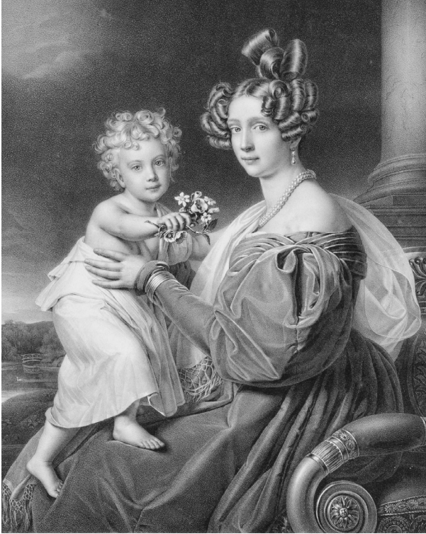
Erzherzogin Sophie mit Franz Joseph, Lithographie von Gottlieb Bodmer nach Joseph Karl Stieler

kamen dann auch die Amme und der Lakai seiner kleinen Schwester. So erfolgten die Anfänge seines Fremdsprachenunterrichts, der von der Aja sehr gefördert wurde, auf recht natürliche Weise. 32