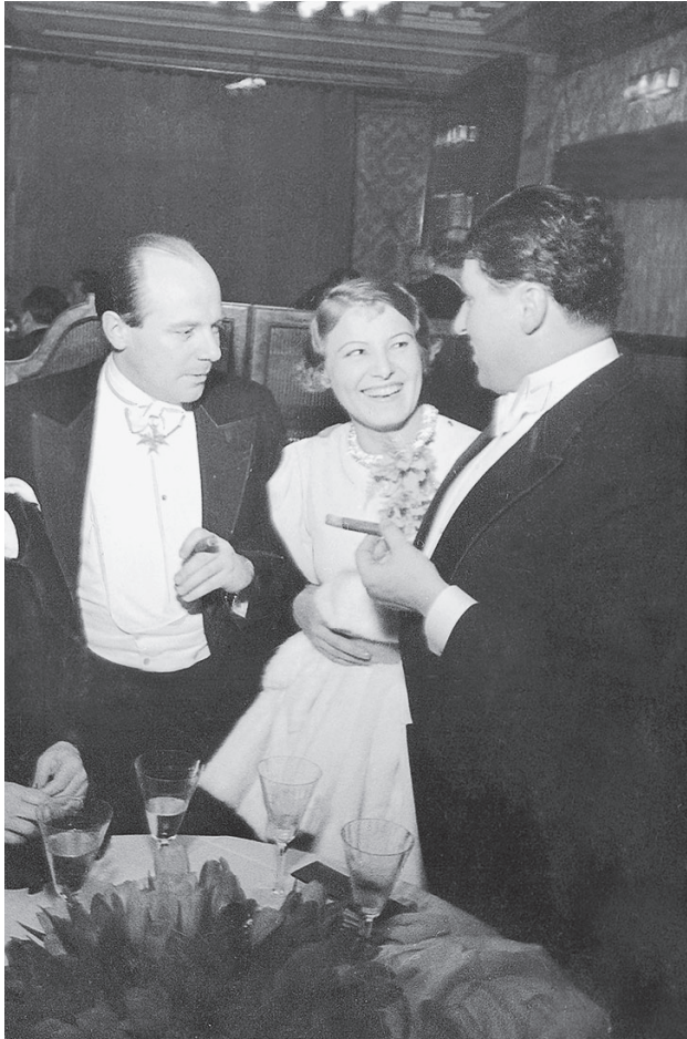
von links nach rechts: Ernst Udet, Ehmi Bessel und Carl Zuckmayer auf dem Berliner Presseball, 1933

Amerika auf, zeigt Sturzflüge, Spiralen, Loopings, bei denen er den Propeller abstellt. Oder er fliegt so knapp über der Grasnarbe, dass er mit der Tragfläche Taschentücher vom Boden aufhebt. Er ist und bleibt ein fröhlicher Hasardeur. Die Ufa hat ihn für sich entdeckt und in einigen Abenteuerfilmen mit Leni Riefenstahl zusammengespannt, für die er im Hochgebirge auf Gletschern landet oder mit seiner Maschine durch einen Hangar hindurchfliegt, während sich die Umstehenden entsetzt zu Boden werfen. Die Berliner Klatschblätter lieben Udet, seine Affären mit Schauspielerinnen wie Ehmi Bessel, seinen stadtbekannteren amerikanischen Sportwagen, einen Dodge, und seine öffentlich zelebrierten Freundschaften mit Filmstars wie Riefenstahl, Lilian Harvey oder Heinz Rühmann.