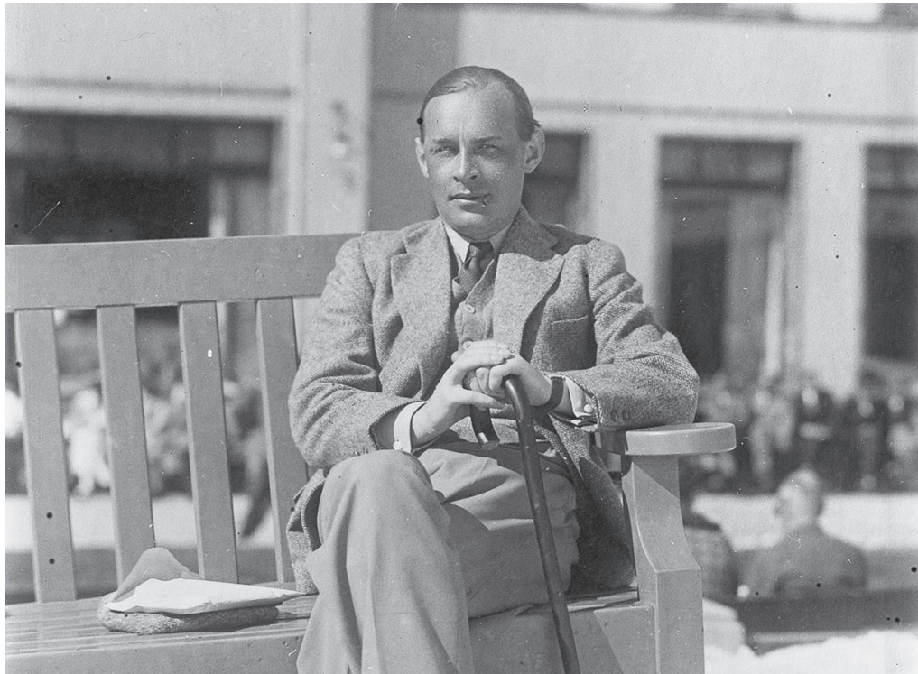
Erich Maria Remarque im Jahr 1929

Nach dem Presseball bleibt Remarque deshalb nur noch für eine kurze Nacht im Hotel. Wer nach Schleicher der neue Kanzler wird, betrifft ihn im Grunde gar nicht mehr, genauso wenig wie die Frage, ob dieser Ball der letzte Tanz der Republik war. Sonntagfrüh setzt er sich gleich nach dem Frühstück in seinen Wagen, einen Lancia Dilambda – er liebt schnelle Autos und hohes Tempo –, und startet Richtung Schweizer Grenze. Es ist eine lange, kalte Fahrt, von Nord nach Süd quer durch das winterliche Deutschland. Erst knapp zwanzig Jahre später wird er seine Heimat wiedersehen.