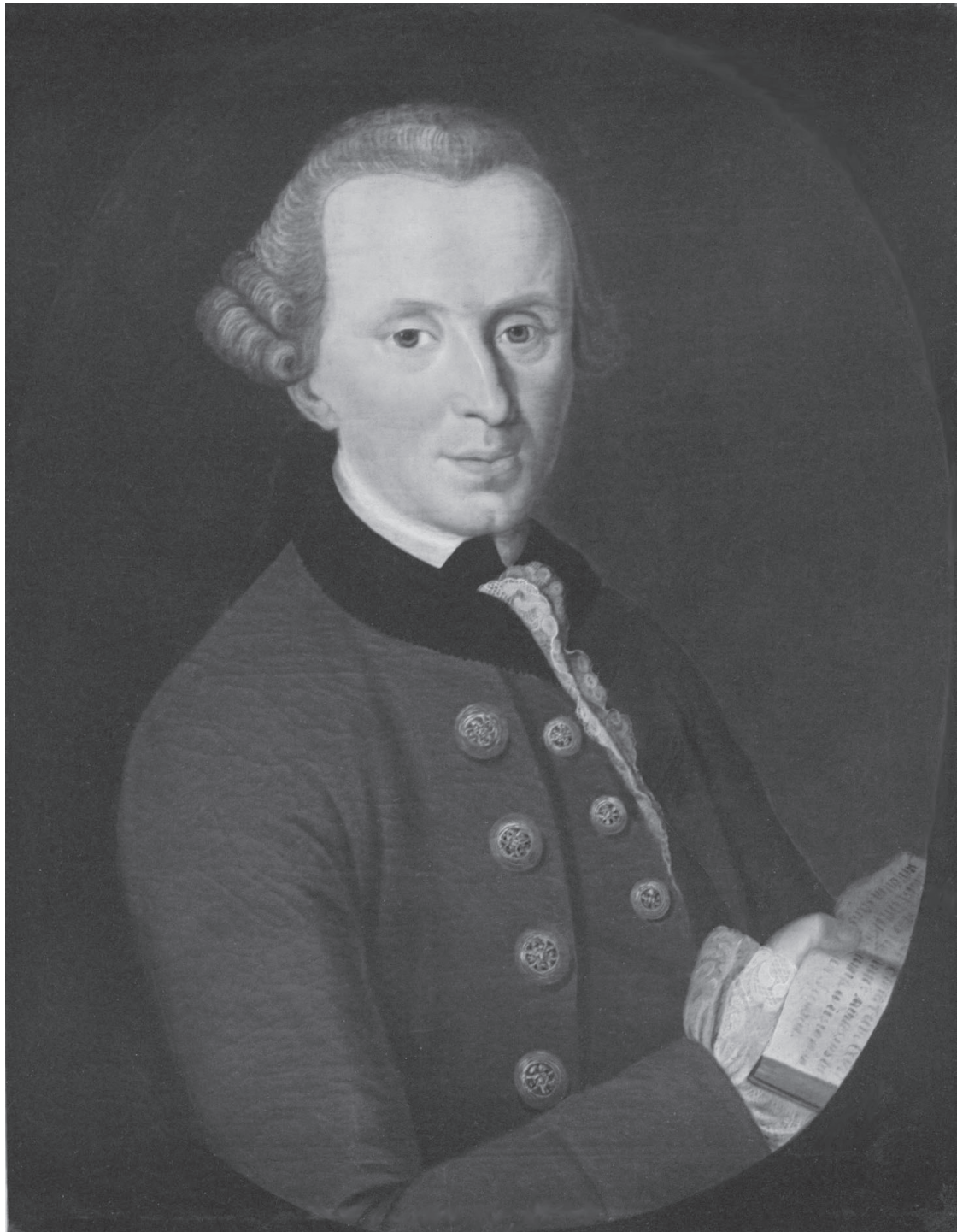
Immanuel Kant. Gemälde von J. G. Becker, 1768