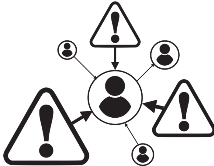
Darstellung eines übermäßig egozentrischen sozialen Netzwerks

können, was andere möglicherweise denken, und uns entsprechend überlegen, wie wir uns angesichts dessen verhalten sollten. Aber das erfordert ein wenig Übung und Geschick. Diese Fähigkeiten entwickeln sich im Laufe der Kindheit. Bis wir das Erwachsenenalter erreichen, haben wir mehr Sorgen und Nöte angehäuft als unser jüngeres Ich. Wenn wir also in unserem eigenen selbstbezogenen Universum gefangen sind – was häufig der Fall ist –, kann es gut sein, dass sich dieser Selbstfokus auf unsere Probleme richtet und wir alles über Gebühr aufblähen. Betrachten wir einmal die folgende Darstellung des eigenen Ich in Relation zu anderen, zu unseren Problemen sowie zum Wechsel der Perspektiven.