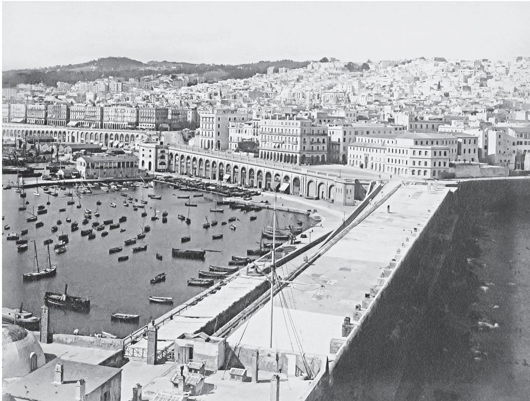
Der Hafen von Algier, um 1882